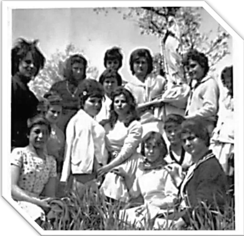
Foto di ragazze di Mafalda e di S. Felice con la statua della Madonna del Castello

In seguito al tonfo si sentono le bambine che, battendo le mani cantavano: "Bene ha fatto la Madonna".